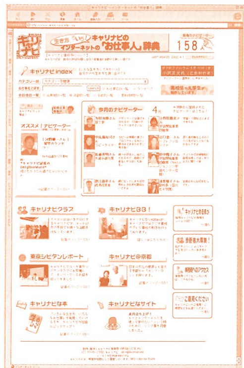
「お仕事人辞典」では、H14.4.10現在158人の職業人を紹介。その人への質問コーナーやその職業に関する書籍・サイトも紹介している

この「お仕事人辞典」は、憧れの職業からあまり知られていない職業まで、様々な仕事に就く大人たちを学生自らが