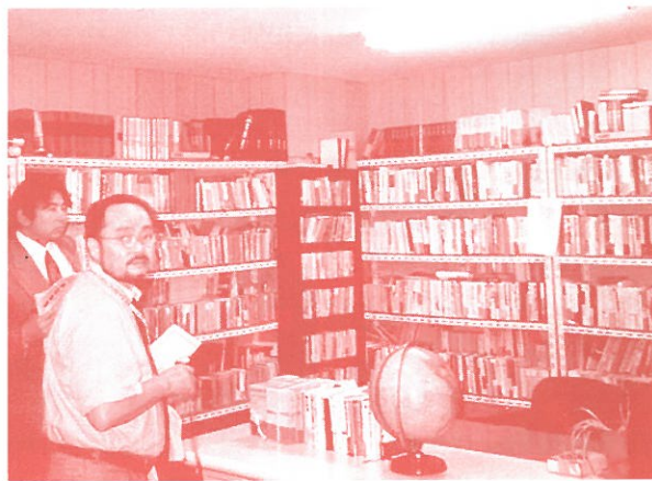
商店街に面した市民図書館。奥はあたふたクッキングの厨房

配食グループ「あたふたクッキング」では、メンバーが自分の都合の良い日に参加し、お弁当を作って高齢者単身住宅などに配達を行っているそうです。メニューは日替わりで、作り終えると昼過ぎには解散します。この日は、ここのお弁当を昼食にいただきました。ほうれん草のおひたしなど健康的でおいしかったです。厨房の手前のスペースは、市民図書館で、いつでも自由に本が借りられるそう。結構たくさん本がありました。