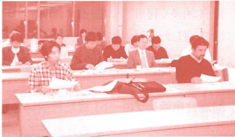
興味津々で聞き入る参加者のみなさん