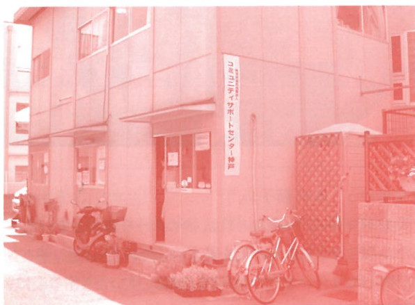
CS神戸の事務所はプレハブの2階建て

まず、訪れたのは阪神大震災で被害を受けた住吉地区にあるCS神戸※2 北海道NPOサポートセンター同様、コミュニティビジネスをやろうという意欲のある団体を自立できるように育てていく活動を行っています。事業規模1億円強とNPOにしては、大きな団体です。事務所はプレハブの2階建て。「神戸ベビー」というおむつ販売会社の敷地を会社のご好意で借りているそうです。