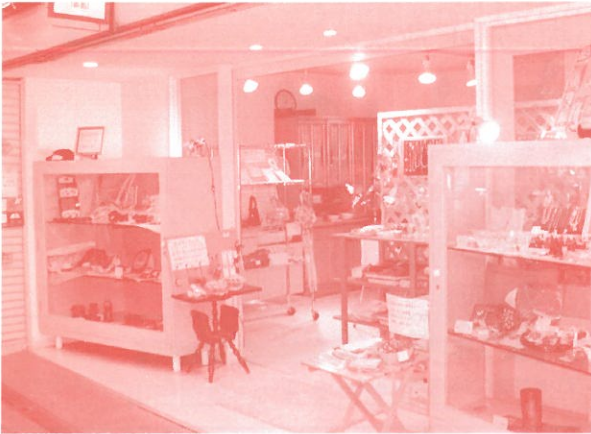
商店街の空き店舗を活用して、障がい者の手作り品などを販売

20日間の実習に訪れていました。団体が休みの日曜には、透明シャッター(カーテン)にし、不在でもあかりをつけ、商店街を明るくみせる努力をしているそうです。このような積み重ねで商店街との協力関係を築いているのだそうです。