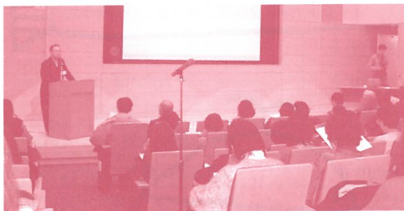
コンベンションホールでの講習風景

私は、札幌国際プラザの外国語ボランティアネットワークの会員です。このネットワークの設立の経緯は、1977年、札幌市の国際交流推進において言葉の壁を解消し、多様な交流活動を促す目的で「外国語ボランティア制度」が発足。その後1987年に国際交流プラザが設立され、制度が交流プラザに移行されました。1988年に、ボランティアが自主的にボランティア同士の交流を行い、その翌年8月に現在のネットワークが誕生しました。札幌国際プラザのボランティア登録数は現在約800名。話されている言語数は英語、中国語をはじめ、シンハラ語、ゾンガ語など約20ヶ国語です。ボランティアの男女比率は約1:6と女性が多いです。