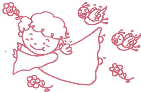
イラスト=高見佳枝さん