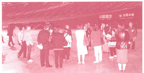
札幌ドームでの研修

今年の6月にコンベンションホール(SORA)がオープンしたのですが、そのボランティアの養成をするための講座に参加しました。その内容として、札幌と小樽の観光コースを実際に歩いたり、コンベンションホールを見学するというものがありました。