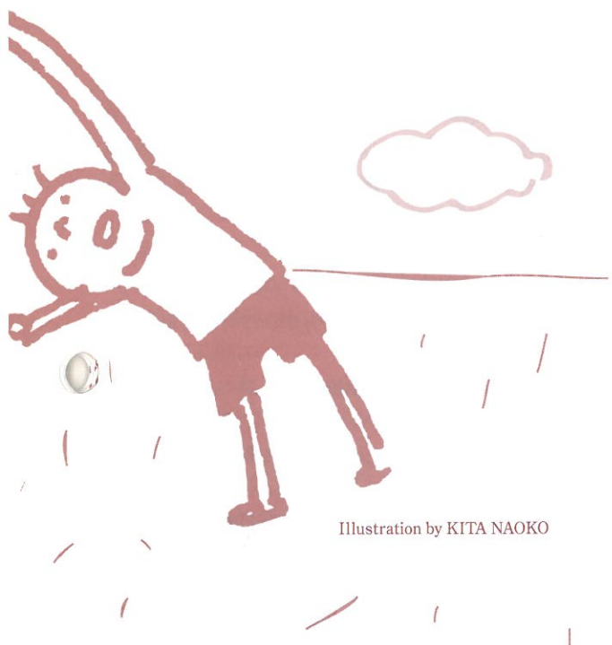
Illustration by KITA NAOKO