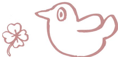
Illustration by SUMIYOSHI SHIZUKA