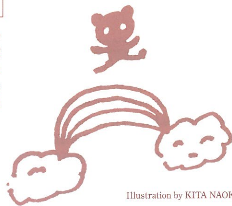
Illustration by KITA NAOKO