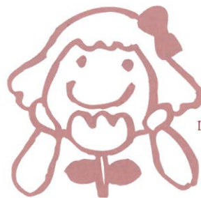
Illustration by SUMIYOSHI SHIZUKA