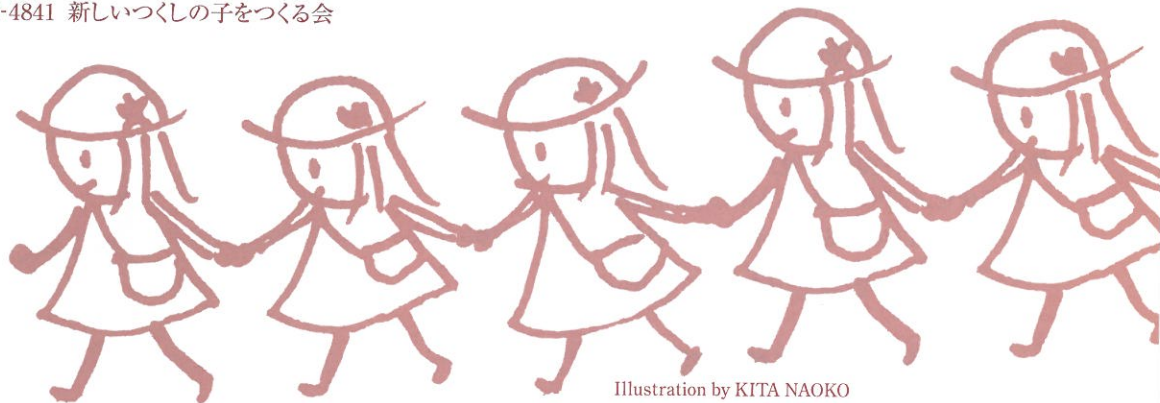
Illustration by KITA NAOKO

受付時間は17:00～20:00。留守の時は、留守電に連絡先を入れて下さい。折り返し連絡させていただきます。