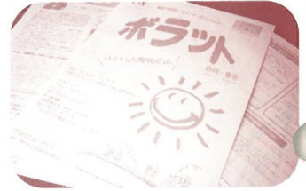
●道南で起こった事を紹介するコーナーや、函館出身のミュージシャンの方のコラムなど、地元が元気になる話題が満載です。次号は6月20日発行。