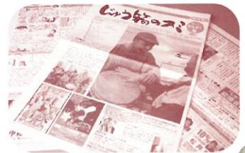
●街のすみっこで見えづかった宝物が、ここではキラキラと光って紹介されています。みなさんの笑顔で、心が温かくなります。次号は、6月5日発行。

地域情報誌が地元の情報などを紹介して地域の方々の元気付けに一役買い、その方々から元気をもらい誌面もいきいきとしてくる。そんな風に、地域と情報誌が一体となって両方が元気になっていけたら、と思っています。月刊ボラナビも、ボラットさん・じゅう箱のスミさんの元気をもらい、さらにたくさんの事をボラナビを応援して下さるみなさんと一緒にしていけたらいいな。(菅原)