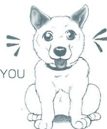
Illustration by YOU