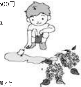
Illust by 楓アヤ