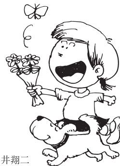
Illust by 朝井翔二