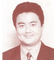
堀尾正明アナウンサー