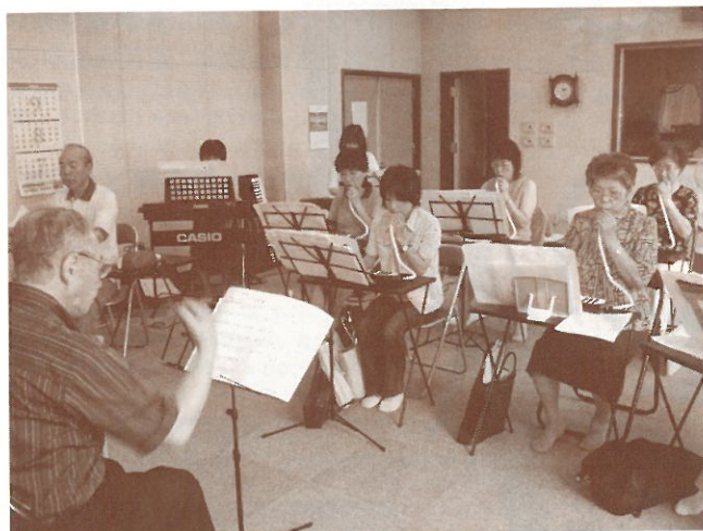
メンバー募集中!(詳細は4ページ)

押し入れにしまって、使われなくなった楽器を再活用したいと思い、アンサンブルを結成しました。全日本シニアアンサンブル連盟に加入しており、昨年は宇都宮市での全国大会に出場し、今年は9月に調布市での大会に出場します。慰問は、元気をあげたい、楽しんでいただきたいという気持ちでやっています。