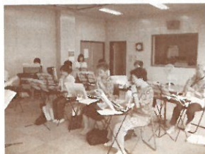
曲は「ゆうやけこやけ」「浜千鳥」など