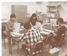
ボラボラさん達が仲良く作業(7/27)