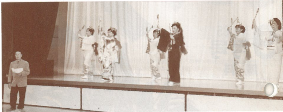
演目は自分達で考えてます