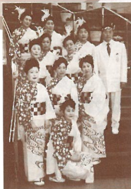
華やかな衣装で全員集合