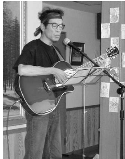
毎回「何か」を得て進化しています