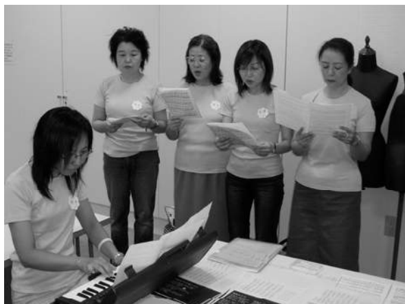
息の合ったハーモニカが心地よく響きます