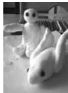
宇宙人…?!ではありません(9/20)

【ボラナビHPの「今日のボラナビ」より】 ボラナビの新マスコット、ボラちゃん(魚)、ナビちゃん(人)です。