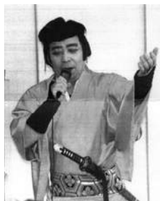
人情味ある時代劇を見てください