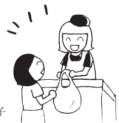
Illust by 片岸夕希子