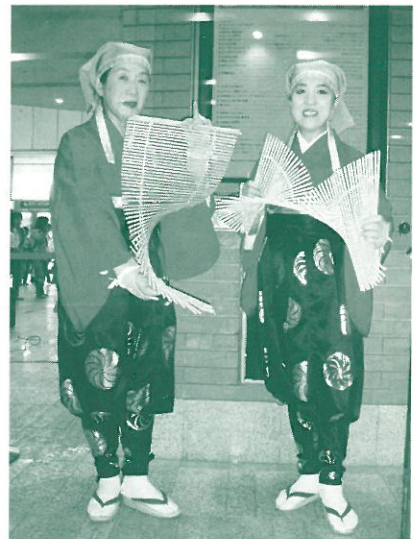
土地柄に合わせてオリジナルの技も披露しています