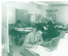
みんな作業に没頭中(10/05)