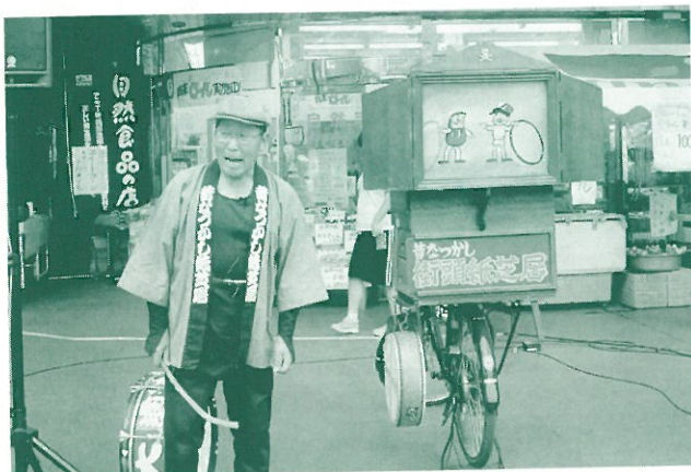
「黄金バット」をぜひ見てください

子どもの頃に見た大道芸の魅力にすっかり心を奪われ、そのすばらしさを伝えるために活動を始めました。現在、同じ志(こころざし)を持つ仲間が集まり、「路地裏芸を楽しむ会」を設立。中でも、昔ながらの紙芝居を次代を担う若い仲間へ引き継ぎ、下町の文化として残していこうとがんばっています。