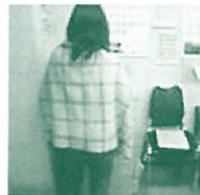
風邪を引いたスタッフS(10/17)