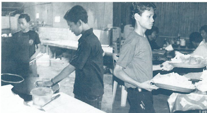
子どもレストランでは15歳以上の26人が働いている。

このレストラン学校で、鍋料理をごちそうになりました。こまめにスープを足したり、ご飯をよそってくれるのが子どもなのでとまどいましたが、子ども達が早くレストランの仕事に慣れて、ここ以外の店で働けるようになれば経済的に自立できるので、多くの人に来てほしいと言われました。子どもたちはみな、観光客と会話ができるように、英語または日本語を勉強しています。お客さんを相手に勉強の成果を試すのが楽しみだと言って、たくさんおしゃべりしてくれました。