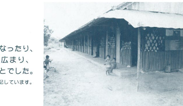
家は長屋づくりの3棟で、母子家族や障がい者家族に分かれて生活している。

CVSGジャパンのスタッフは町で物乞いをする大人や子どもにも積極的に話しかけて、この村での生活を勧めます。でも、村に来て生活を始める人の中には、「農作業が辛い」、「物乞いをする生活のほうが簡単に、よりお金が集まる」と言って、出て行く人も多いそうです。農作業で得られる収入は一日250円程度。物乞いをすれば日によってその数倍も得られることがあります。観光客が、哀れに思っただけで気軽に渡すお金が、彼らの働く意欲をなくしているのだそうです。