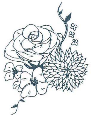
Illust by 片岸 夕希子