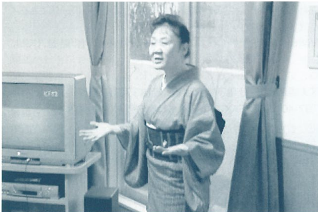
流行歌、演歌が好きな方は、一緒に活動しませんか。

カラオケ大会で上位入賞の経験をいかし、高齢者住宅を定期的に回る活動を4年前からしています。訪問すると喜んでくれ、それが生きがいになっています。歌うことができないお年寄りもありますが、手拍子を取ったり体を動かし、一緒に楽しさを感じています。「お昼だよ! 演歌はいいね」(さっぽろ村ラジオ金曜日12:00~)に出演しています。