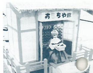
会員手作りの「からくり人形」。前の賽銭箱にコインを入れると、扉が開き巫女がおみくじを持って現れる。