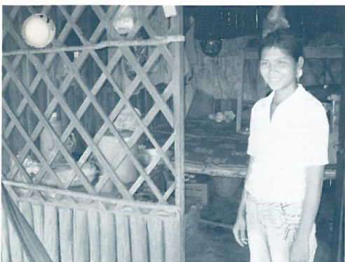
一時滞在の家は4畳ほどの広さ。ここで家族が暮らす。早く貯金をためて、自立村(CVSG運営)の広い家に引っ越すことを促すため。

CVSGジャパンのスタッフは町で物乞いをする大人や子どもにも積極的に話しかけて、この村での生活を勧めます。でも、村に来て生活を始める人の中には、「農作業が辛い」、「物乞いをする生活のほうが簡単に、よりお金が集まる」と言って、出て行く人も多いそうです。農作業で得られる収入は一日250円程度。物乞いをすれば日によってその数倍も得られることがあります。観光客が、哀れに思っただけで気軽に渡すお金が、彼らの働く意欲をなくしているのだそうです。