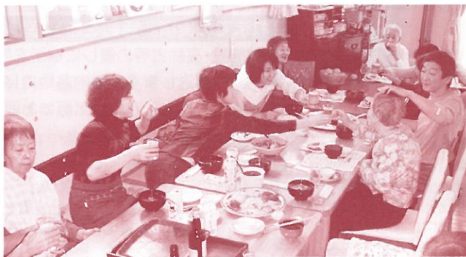
花凧の食事は常にお酒付き

花凧の活動は、「一人ひとりの必要に向かい合ったら、こうなっていた」に尽きます。大きな施設に多機能が備わっているのではなく、これからは住み慣れた地域に、小さな施設がそれぞれの機能を持って点在し、多様なサービスを気軽に容易に手にできることが必要でしょう。そんな地域をつくる力になるのが、今の私の「なりたい自分」です。