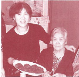
春分の日、花尻家族でぼたもちづくり

北海道の多くの市民活動家の中から、まさに「NPO な人」として紹介したい方に、これまでのエピソードを教えてくださいました。