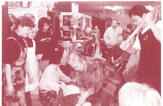
年末の花尻もちつき大会

2000 年 4 月にそれまで 19 年住んでいた十勝から札幌に転居し、任意団体を立ち上げ、12 月に活動を始めました。知らぬ土地に知らぬ人ばかり。当初の会員は家族に親戚、夫の知人、会社の上司、十勝の仲間とインフォーマルな集団でした。その後、活動理念に賛同して下さった方が一人二人と増え、活動開始時には 60 人が会員として支えてくれるようになっていました。