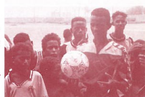
サッカーから始まる国際交流

主な仕事内容は事務仕事から力仕事まで、様々なクルーズ出発前の準備作業。「ボランティア活動してみたい」方から「地球一周したい」方まで、年齢制限、必要資格等一切ありません。説明会は随時行っていますので、資料(無料)をご請求の上お気軽にご参加ください。