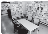
大通公園すぐ！創成川沿い2条市場北側